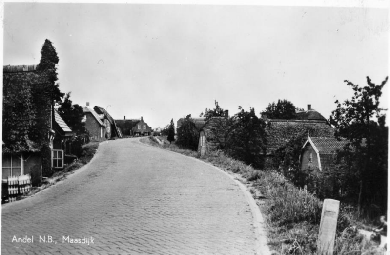
Andel - N.B., Maasdiijk

Ons koor heeft de afgelopen weken een aantal mooie momenten mogen meemaken. Zondag 30 april waren we aanwezig tijdens de eredienst in de Gereformeerde kerk in Andel, dinsdag 16 mei hebben we een mooie uitvoering gegeven in 't